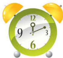
звук часового механизма