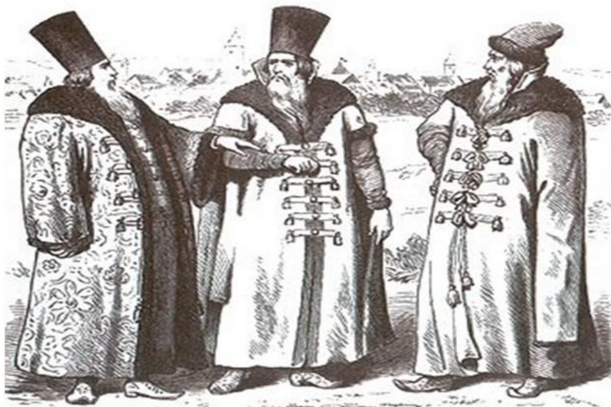
Русские бояре XVI-XVII вв.

У одежды дворян и бояр были очень длинные рукава