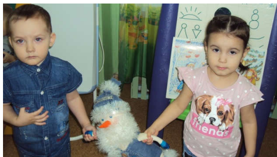
Физминутка «Весёлый Снеговик»

Воспитатель:- Давайте немного потанцуем с весёлым Снеговиком