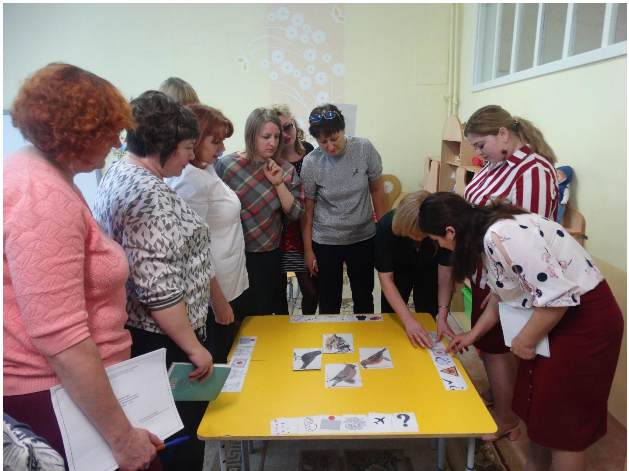
Сотрудничество с родителями. Марафон «Семейная газета»