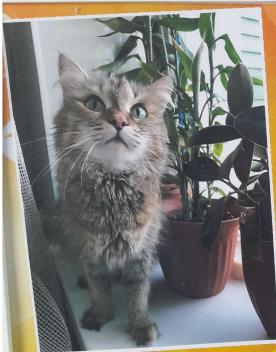
Моя пушистая подружка "Пикси"