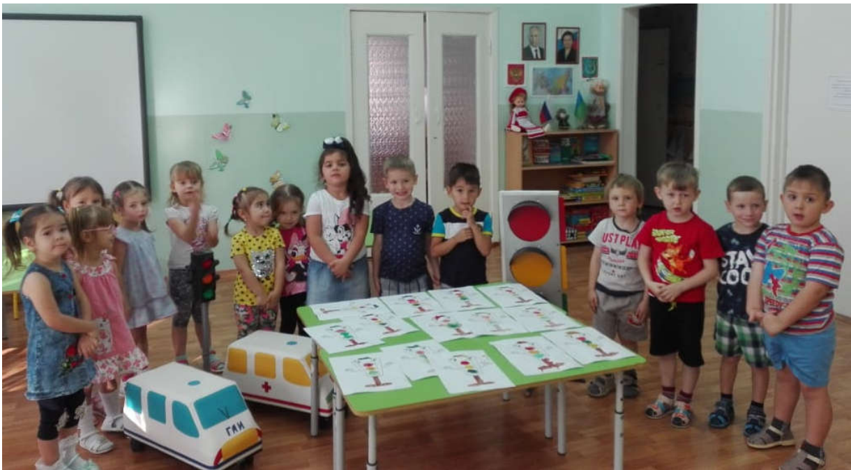
Знакомство с дорожными знаками.