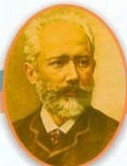
Петр Ильич Чайковский Великий русский композитор