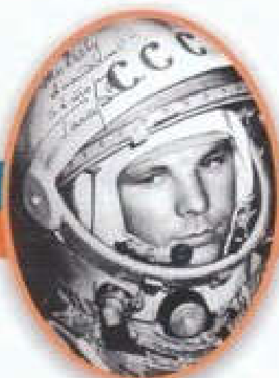
Юрий Алексеевич Гагарин Первый космонавт