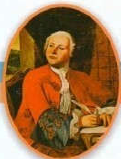
Михаил Васильевич Ломоносов Великий русский ученый

Ты, конечно же, вспомнишь, что Александр Сергеевич Пушкин написал много прекрасных стихов и чудесные сказки: «Сказка о царе Салтане», «Сказка о рыбаке и рыбке», «Сказка о мертвой царевне и о семи богатырях», «Сказка о золотом петушке». Петр Ильич Чайковский писал необыкновенно красивую музыку, создал цикл пьес «Времена года» и хорошо знакомый тебе «Детский альбом». Михаил Васильевич Ломоносов — великий русский ученый, он многого добился в самых разных областях знаний: литературе и искусстве, физике и астрономии, географии и истории. Им сделано много важных научных открытий. Юрий Алексеевич Гагарин был первым космонавтом, первым человеком, облетевшим на космическом корабле «Восток-1» нашу планету.