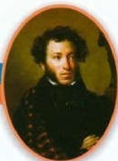
Александр Сергеевич Пушкин Великий русский поэт