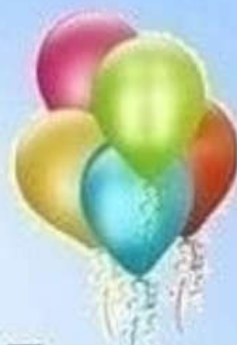
Пять воздушных шаров