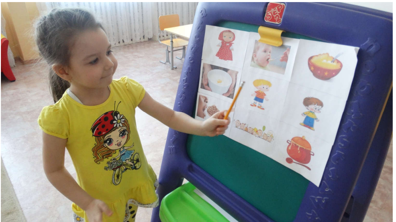
8. Рассказывание скороговорки детьми по памяти.