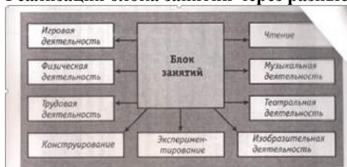
Реализация блока занятий через разные виды деятельности ребенка

Согласно «Концепции экологического образования», в его содержание на всех уровнях включаются познавательный, ценностный, нормативный и деятельностный компоненты. Каждый из них выполняет свою функцию в решении задач экологического образования. По своему содержанию эти четыре компонента охватывают все области современной комплексной экологии и, следовательно, должны быть представлены и на дошкольном уровне. В таблице 4 приведен пример отражения указанных компонентов в содержании блоков программы «Наш дом — природа».