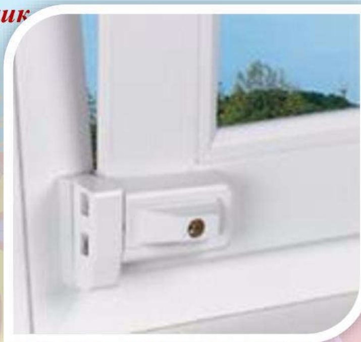
Блокировщик с кнопкой