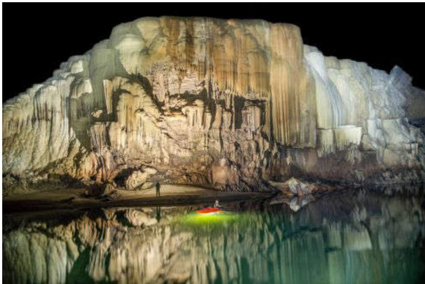
13. (Фото John Spies):